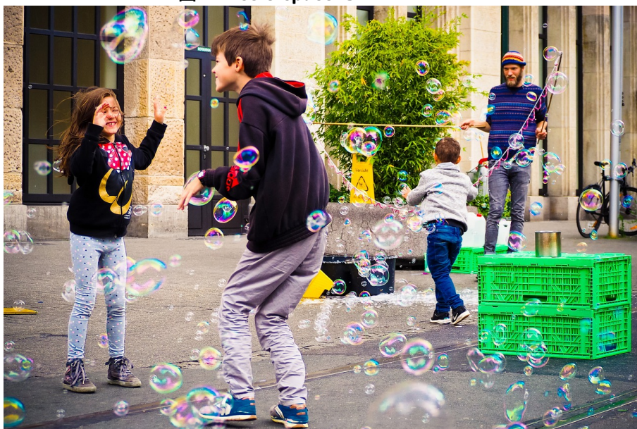
図 5 オリジナル