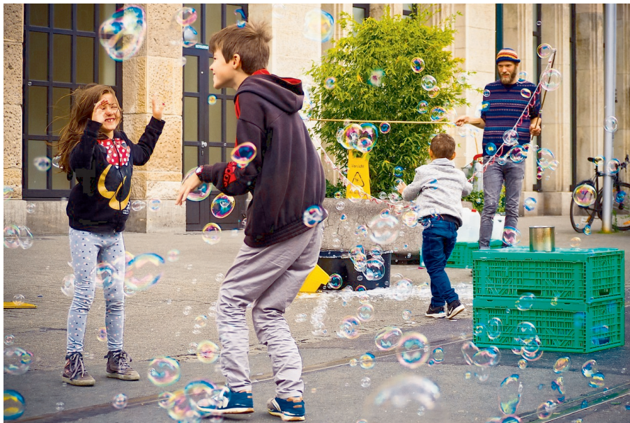
図 4 -colorspace CMYK EPDF