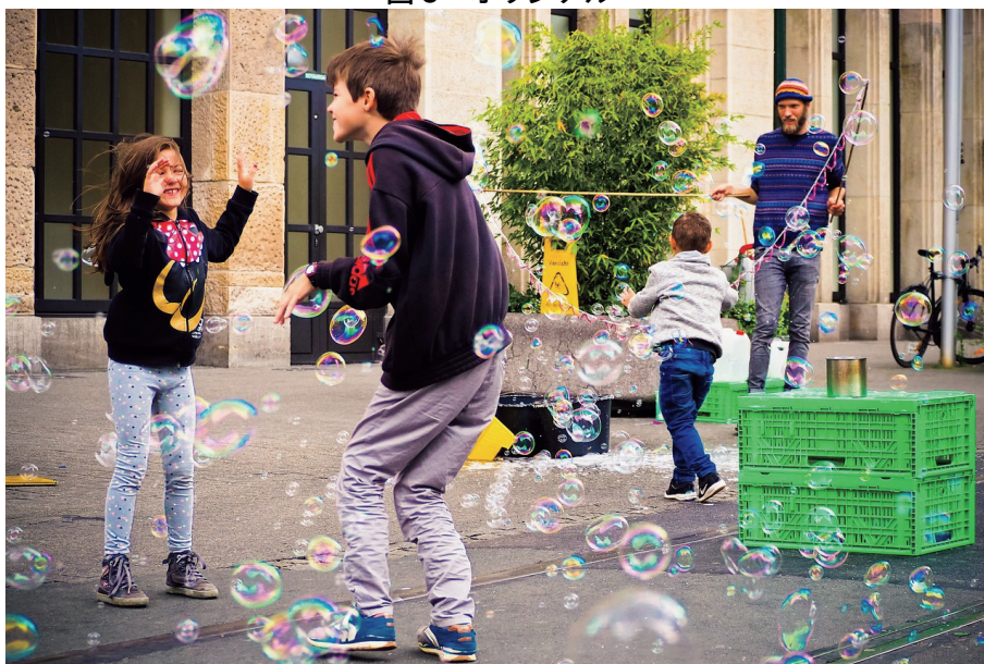
図 6 -profile sRGB2014.icc -profile JapanColor2011Coated.icc